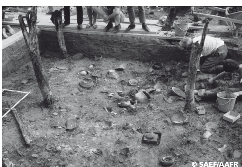
Découverte, en 1968 au Landeron, d'un atelier de potier de l'âge du Bronze final (vers 1000 av. J.-C.).