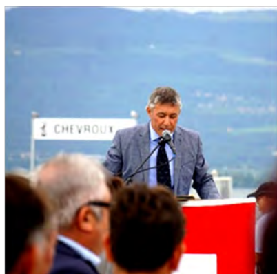
Discours du Syndic à cette occasion