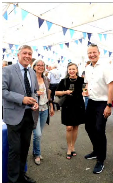
La Présidente du Conseil général en compagnie des orateurs du jour