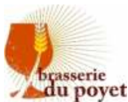
La brasserie du Poyet - Autavaux

Animation du jour brassage en plein air!