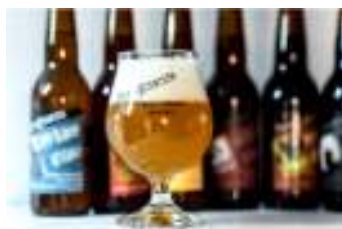
La Faougeuse - Villarepos