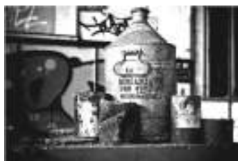
La Mécanique des fluides - Marly