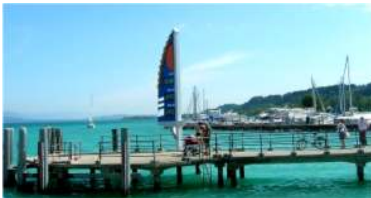
Le débarcadère ressemblera à celui de Portalban

La demande d'approbation émane de la Société de navigation (LNM) ; la mise à l'enquête de ce projet a été effectuée du : 18 mai 2018 au 19 juin 2018 et n'a fait l'objet d'aucune opposition. ./..