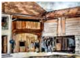
La Ferme d'Ostende - Chevroix

Les sept micro-brasseries présentes vous invitent à la découverte de cette passion qu'est l'art brassicole.