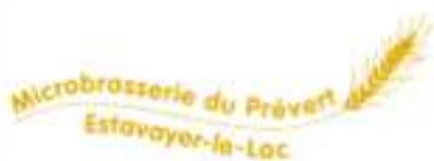
Le Prévert - Estavayer