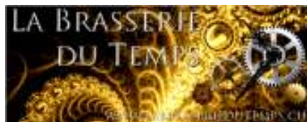
La brasserie du Temps - Treystorrens