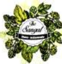
The Sangal - Estavayer